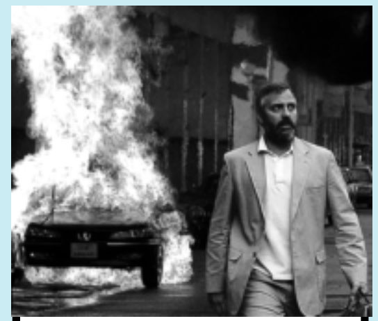
George Clooney numa cena de Syriana - A Indústria do Petróleo