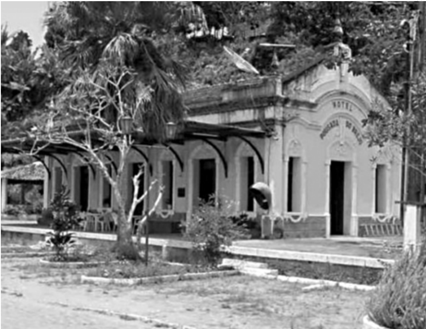
A antiga estação ferroviária, hoje transformada em hotel, é um dos mais belos patrimônios históricos do município de Bananeiras, ponto de parada obrigatório para quem visita a cidade