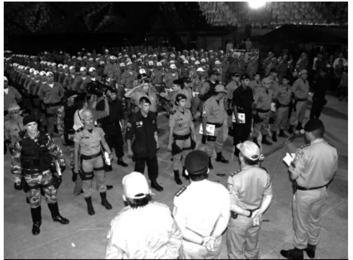
Um plano especial elaborado pela Secretaria de Segurança vai atender às demandas em todo o Estado

"Estamos investindo na agricultura melhorando a produção, a organização coletiva e o escoamento da produção. Também investimentos na produção de produtos agroecológicos e na compra direta dos alimentos para a merenda escolar, presídios e entidades para fazer circular o dinheiro na comunidade e evitar que continuemos importando frutas e verduras de outros Estados", ressaltou o governador.