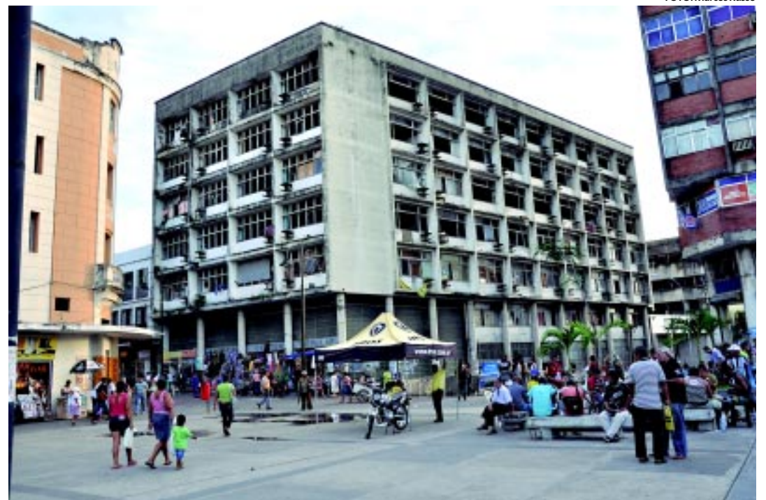
No prédio que um dia foi do INSS, em João Pessoa, habitam hoje cerca de 70 famílias há três anos

Segundo uma das moradoras, que pediu para ter apenas as iniciais do seu nome divulgadas, as famílias vivem no local de forma abandonada. "Estamos há três anos sem