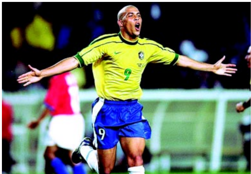
O Fenômeno está treinando no Corinthians e na próxima segunda vai estar à disposição de Mano Menezes

FESTA DE DESPEDIDA - A maior homenagem reservada ao jogador campeão da Copa do Mundo de 2002 - e 1994 como reserva - será realizada durante o jogo de despedida, contra a Romênia. Os detalhes da cerimônia do Estádio do Pacamebu ainda não foram divulgados.