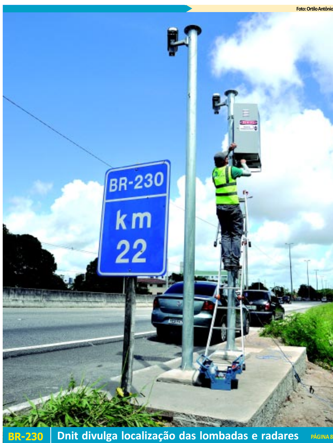
BR-230 Dnit divulga localização das lombadas e radares PÁGINA 8

a sua situação fiscal para até o dia 31 de julho deste ano, com parcelamento em até 60 meses. Os contribuintes podem procurar as recebedorias e as coletorias, até o dia 31 do próximo mês, para parcelar seus débitos. PÁGINA 11