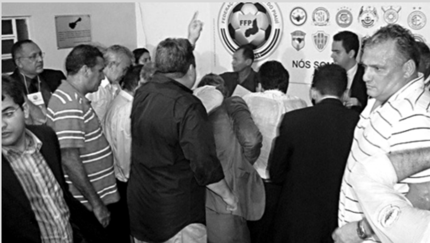
Dirigentes do futebol do Piauí buscam entendimento para a conclusão do Campeonato de 2011 que está prejudicado devido às intervenções da CBF

- O torcedor está ansioso para o campeonato reiniciar. Ele quer ver jogo. Há um acordo firmado e assinado entre os quatro semifinalistas para entrar em campo na próxima quinta-feira, e vão ser disputados novamente os jogos, de ida e volta, com os clubes dentro das condições que manda a regra do campeonato - garantiu.