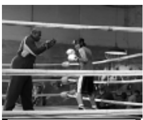
A Globo exibe hoje a comédia Jump In