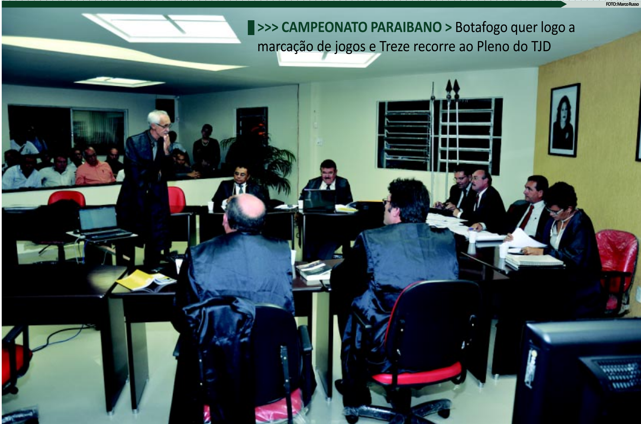
Reunião da última terça-feira na sede da Federação Paraibana de Futebol, onde funciona o Tribunal de Justiça Desportiva, que condenou o Treze a perda de pontos e o afastou da segunda fase do Paraibano

>>> CAMPEONATO PARAIBANO > Botafogo quer logo a marcação de jogos e Treze recorre ao Pleno do TJD