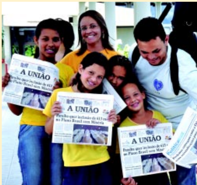
Crianças da LBV estiveram na redação do Jornal, ontem