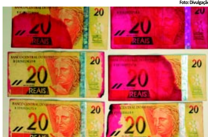
As marcas rosas podem cobrir toda a nota ou as laterais

Os consumidores de baixa renda que têm direito à Tarifa Social de Energia Elétrica poderão fazer o seu cadastramento até 1º de agosto. A redução na tarifa de energia pode chegar a 65% e varia de acordo com a quantidade de kWh consumida. PÁGINA 10