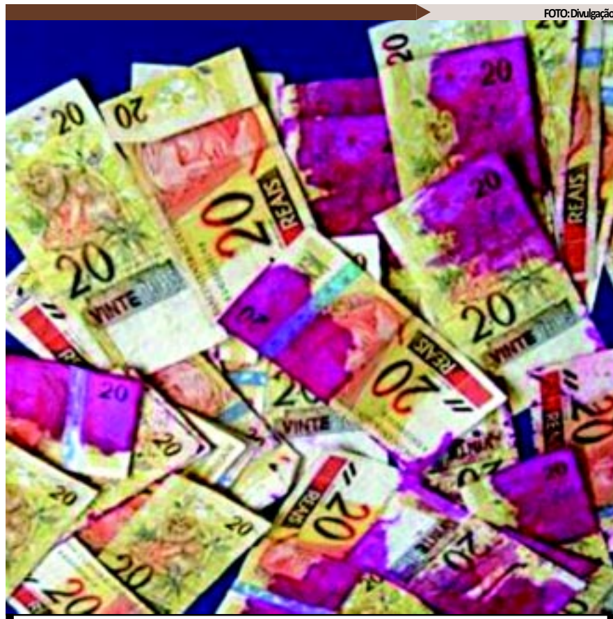
Notas danificadas por dispositivo antifurto deixam de ter validade, segundo o Banco Central

Brasília - O Conselho Monetário Nacional (CMN) e o Banco Central (BC) aprovaram regulamentação sobre o destino de cédulas danificadas por dispositivos antifurto de caixas eletrônicos. Segundo nota divulgada pelo BC ontem, essas notas deixam de ter validade, não podendo mais ser utilizadas como meio de pagamento.