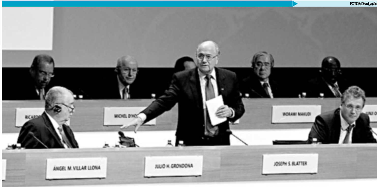
Joseph Blatter com os demais dirigentes da elite do futebol mundial no Congresso da Fifa que o reelegeram para mais um mandato à frente da entidade

Mais cedo, Blatter deixou claro que existe grande possibilidade de mudança nas escolhas de sede das Copas do Mundo. A medida visa acabar com casos de corrupção, como os que foram denunciados pela imprensa mundial. Ao invés de apenas os 22 membros do comitê executivo da Fifa terem direito a voto, o suíço sugere que esta responsabilidade seja aberta para as 208 associações ligadas à entidade.