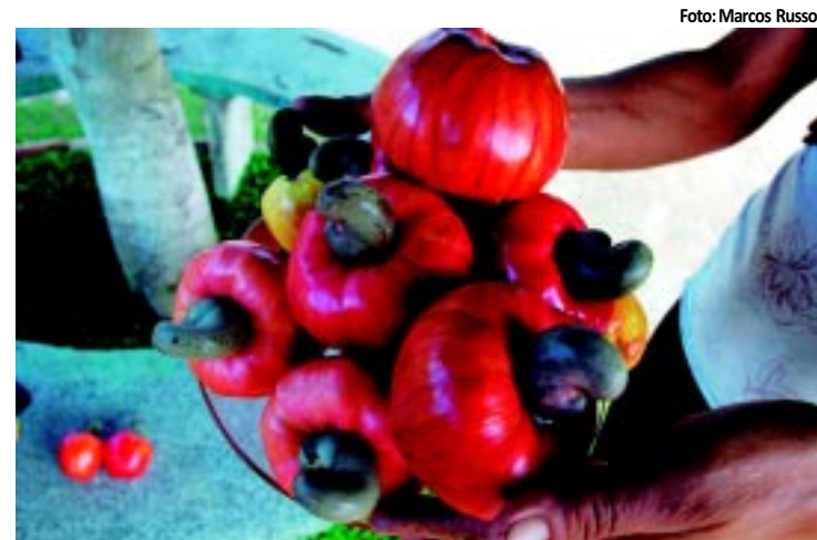
Maturéia é um dos maiores produtores de castanha da PB

salas de aula, sob pena de uma multa diária de R$ 20 mil para o órgão sindical, em caso de descumprimento. O desembargador entendeu que mais de 400 mil alunos estão sendo prejudicados pela greve e ponderou que para muitos a merenda é uma refeição substancial. PÁGINA 9